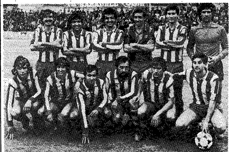
Los de Primera con los de Tercera... ¡qué idea!