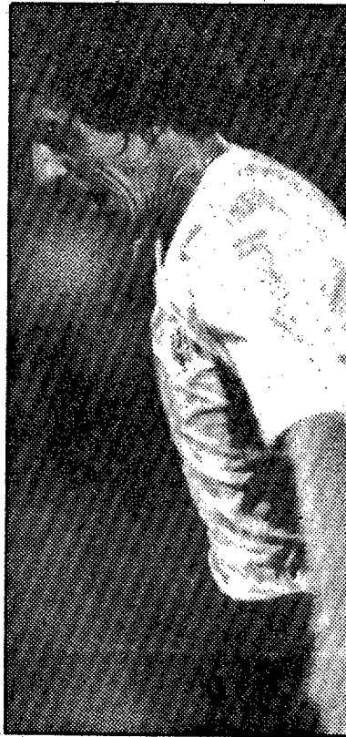
Al internacional uruguayo no le importa jugar en Segunda División