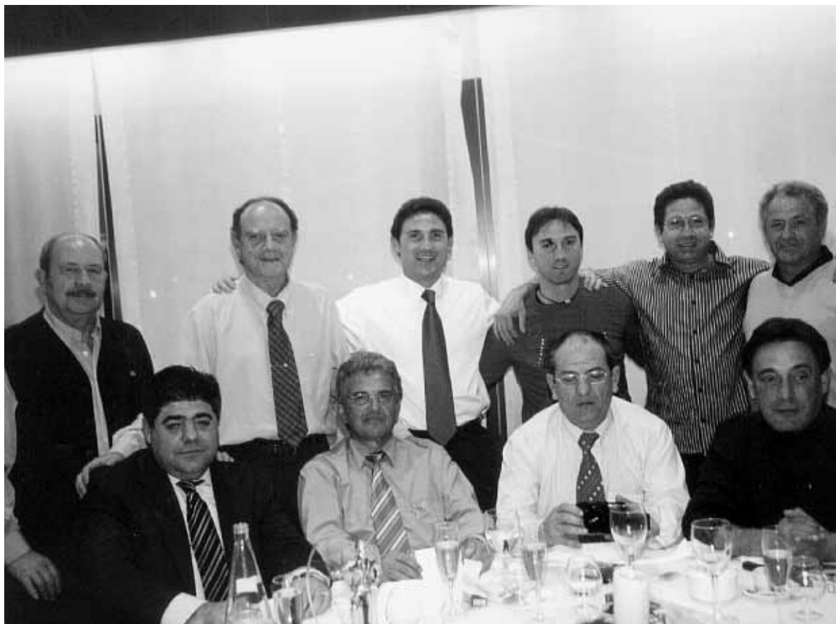
La directiva i el cos tècnic del Blanes formen una autèntica 'pinya' i sempre van junts a qualsevol esdeveniment