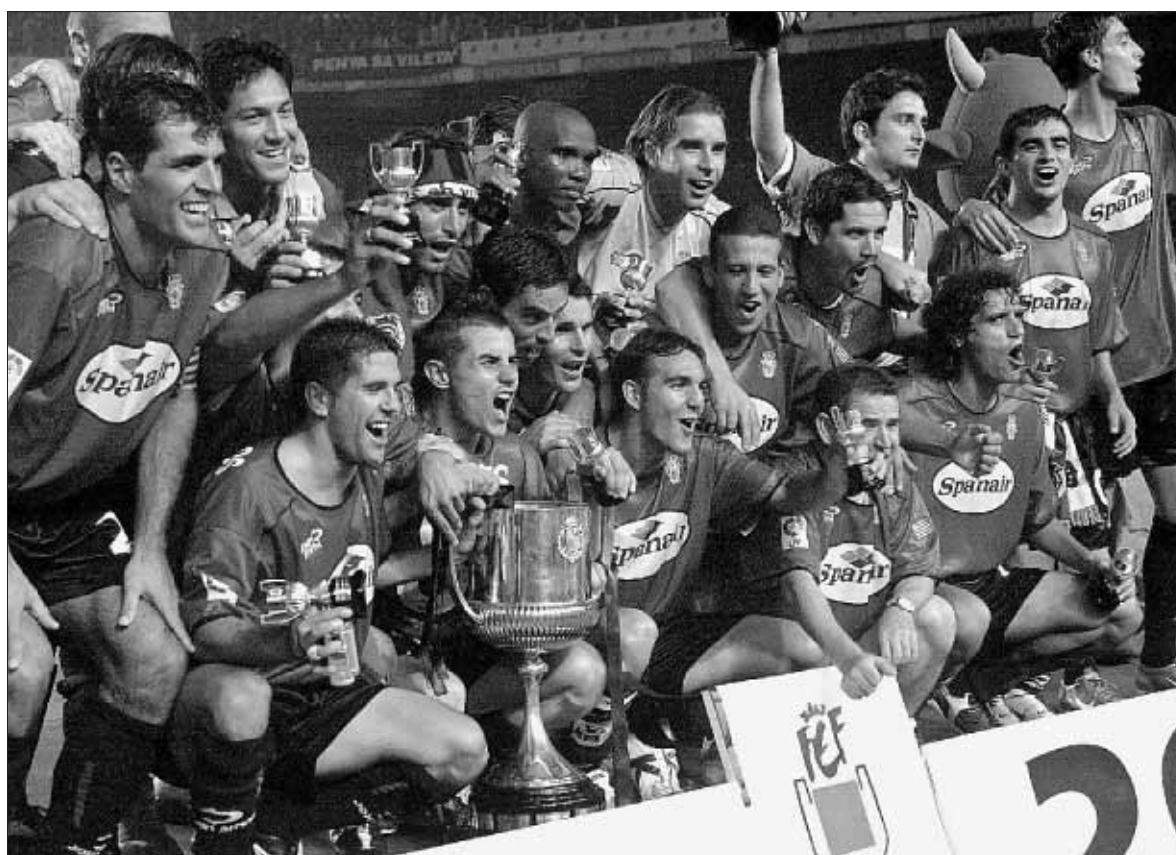
El Mallorca, campeón Los jugadores bermellones posan con el trofeo conquistado tras un partido marcado por la inmensa figura de Eto'o

Árbitro: Iturralde González ★ ★ Mal ★★ Regular ★★★ Bueno ★★★★ Muy Bueno